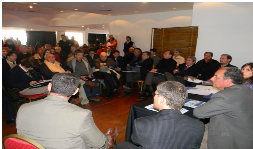
Jornada de trabajo con productores y comerciantes del Partido de San Fernando