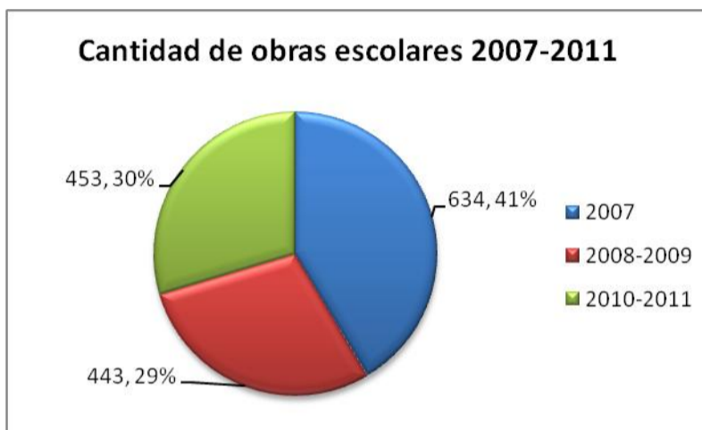
GRÁFICO N°1: DISTRIBUCIÓN ANUAL DE LAS OBRAS REALIZADAS